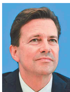
Im Rampenlicht. Steffen Seibert war ZDF-Moderator, bevor ihn Angela Merkel 2010 zum Regierungssprecher machte.