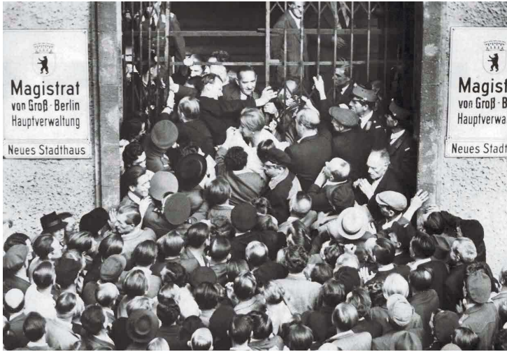
Sturm aufs Stadthaus. Die Sprengung der Stadtverordnetenitzung am 6.9.1948 durch hinbefohlene „Werktätige“ (gr. Bild) war einer der Auslöser für die Gründung des West-Berliner Presseverbandes. Erster Vorsitzender des Deutschen Journalisten-Verbandes wurde Erich Klabunde (links auf dem kl. Bild oben, mit Stellvertreter Helmut Cron). Die Wahl fand im früheren Verlagsgebäude des „Telegraf“ am Bismarckplatz statt (kl. Bild unten).

Im August 1945 fand im Rathaus Schöneberg eine vorbereitende Versammlung zur Gründung des Verbandes der Deutschen Presse statt, der im Oktober vom Alliierten Kontrollrat genehmigt wurde. Entsprechende Verbände in den Westzonen folgten erst Monate später. Allerdings stand die Berliner Gründung, aus