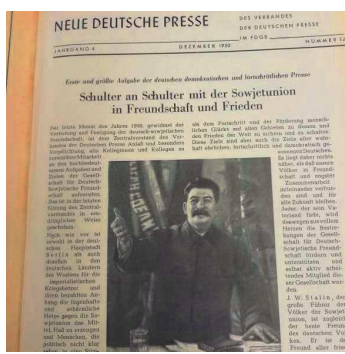
Schulter an Schulter. Die Medien in der DDR – hier die Neue Deutsche Presse – waren zentral von der Regierung gesteuert. Nach 1989 wurden viele Zeitungstitel eingestellt.

Doch im Oktober 1989 beginnt die Revolution auch in den Redaktionen. Nach der Wende stellen die Journalisten alles auf den Kopf und genießen eine Phase der Freiheit und Experimentierlust. „Die Leute waren handwerklich sehr gut ausgebildet und teilweise grandiose Stilisten“, sagt Walther. „Sie haben also geschaut, wie sie in der neuen Republik journalistisch arbeiten können.“ Denn mit der DDR bricht auch ihr Mediensystem zusammen, der VDJ löst sich 1990 auf. „In den Jahren 1991/92 seien laut Walther