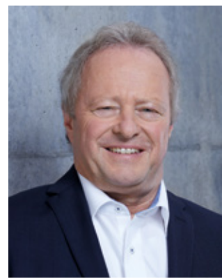
Prof. Dr.-Ing Dr.