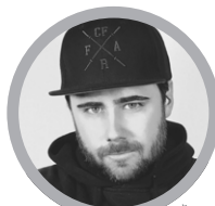
André Karsten © Privat