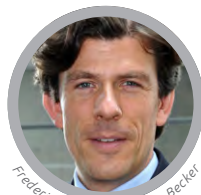
Frederick Richter © Lorenz Becker