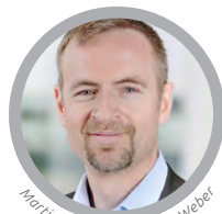
Martin Talmeier