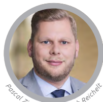
Pascal Ziehm © Christoph Reichelt