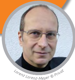
Lorenz Lorenz-Meyer © Privat