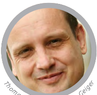
Thomas Mrazek