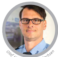
Olaf Hoppe © Polizei Sachsen