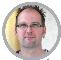
Jan Eggers © Privat