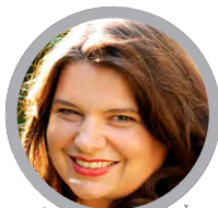
Anja Mutschler © Privat

Ariane Amann, Redakteurin, Magdeburg. Moderation: Andreas Artmann