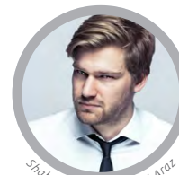
Shahak Shapira © Boad Araz