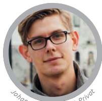
Johannes Klingebiel © Privat