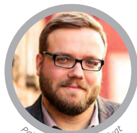
Patrick Wiemer © Privat