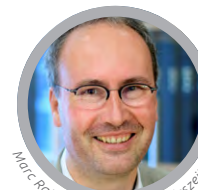
Marc Rath © Lüneburger Landeszeitung