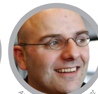
Andreas Artmann © Privat