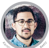
Karsten Schmehl